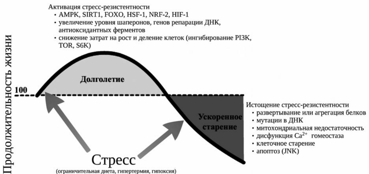
Рис. 2. Механизмы влияния стрессов разной величины на скорость старения и продолжительность жизни организма

У людей-долгожителей повышена чувствительность к инсулину при сохранении его низкого уровня в плазме крови (Cheng et al., 2005). Активность инсулиноподобного сигналинга и уровень экспрессии инсулиноподоб-