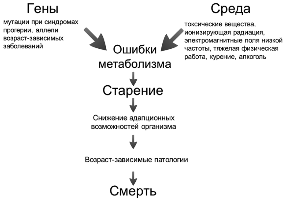
Рис. 1. Влияние внешнесредовых и генетических факторов на скорость старения и развитие возраст-зависимых заболеваний

гормональное стимулирование роста прекращается, но активируются белки, способствующие увеличению стрессоустойчивости клеток. Данный регуляторный путь консервативен в эволюции от беспозвоночных до млекопитающих.